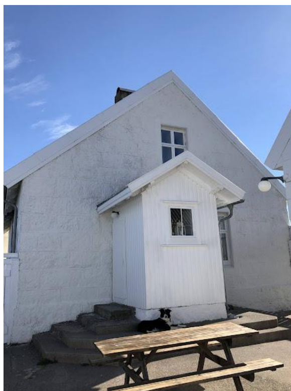
Steinhus før og etter