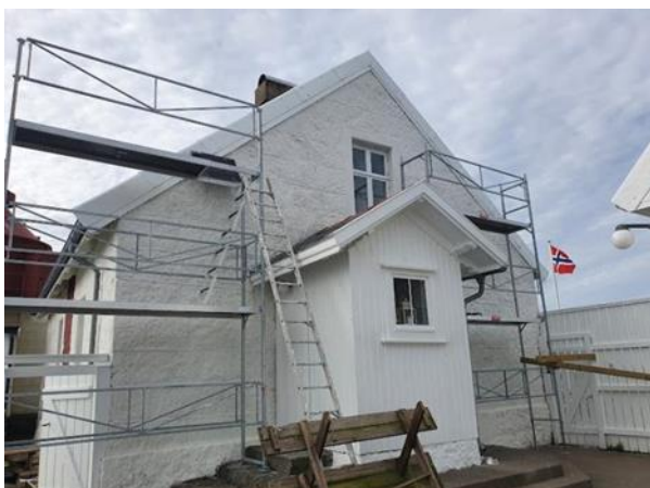
Stilling oppsatt for oppussing av Steinhus