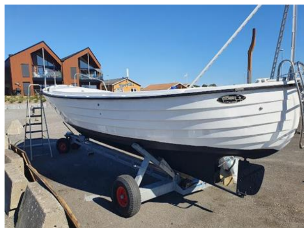
Ferdig oppusset båt